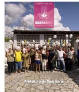
Prefeitura de Guarabira.