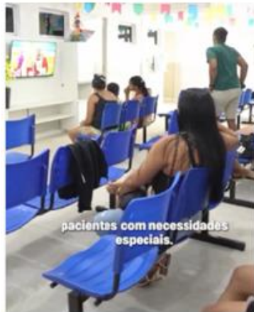
pacientes com necessidades especiais.